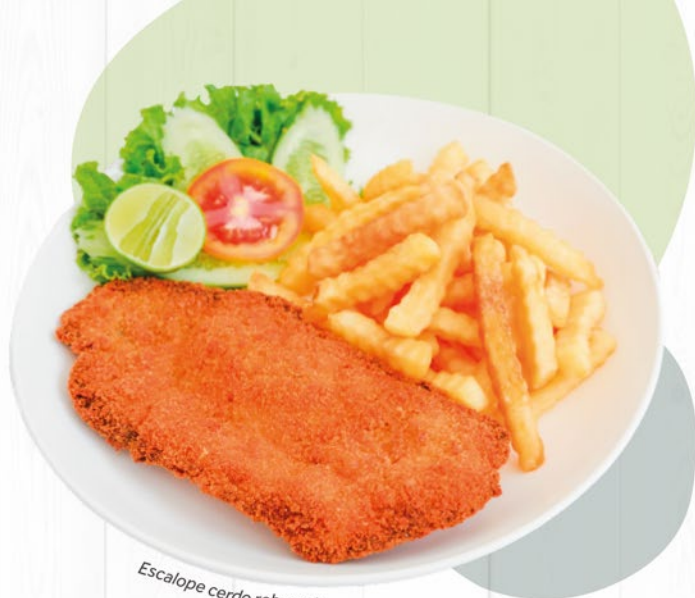
Escalope cerdo rebozado

Battered pork escalope with french fries and salad Paniertes schweineschnitzel mit pommes frites und salat