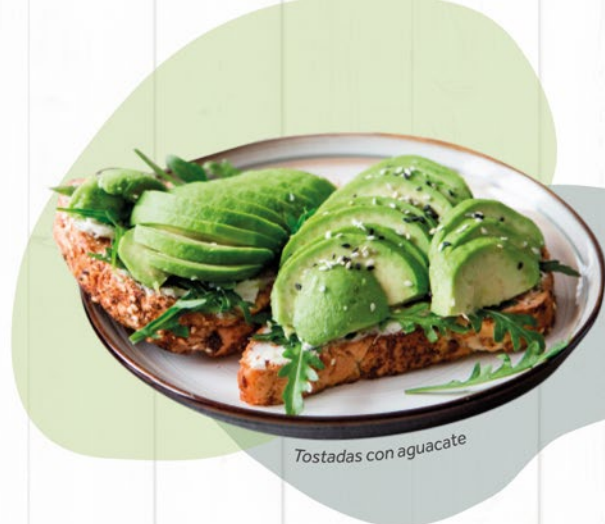
Tostadas con aguacate